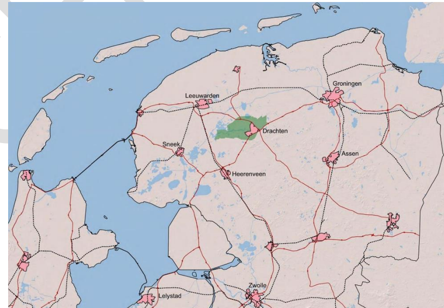
De ligging van Smallingerland in Noord-Nederland

Drachten heeft zich als een broedplaats voor onderwijs (Universiteit, HBO en MBO in samenwerking), ziekenhuis, bedrijven ontwikkeld en vervult deze rol zelfstandig en in aanvulling op omliggende steden als Groningen en Leeuwarden.